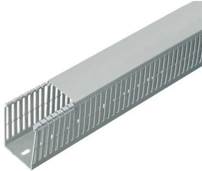
IMMAGINE RAPPRESENTATIVA REPRESENTATIVE IMAGE

Goulottes > Systèmes de tableaux de distribution > Systèmes de câblage > Goulottes sans halogène > Goulotte de câblage > Gris clair - type s - lamelles étroites 4/6/4